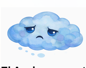
El Azul representa TRISTEZA