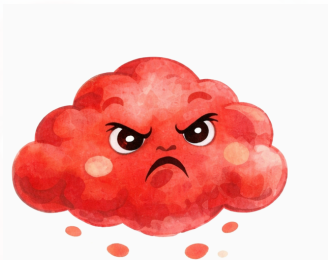
El Rojo representa ENOJO

Cada color del bosque representa una emoción que los niños pueden sentir todos los días. Esta sección te ayudará a acompañar a tus hijos en el reconocimiento y manejo de estas emociones de manera consciente y amorosa. Recuerda: no hay emociones “buenas” o “malas”; todas son parte de la vida.