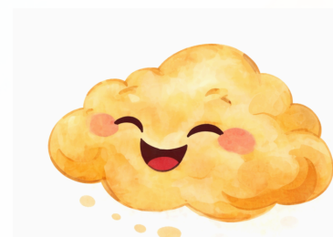
El Amarillo representa FELICIDAD